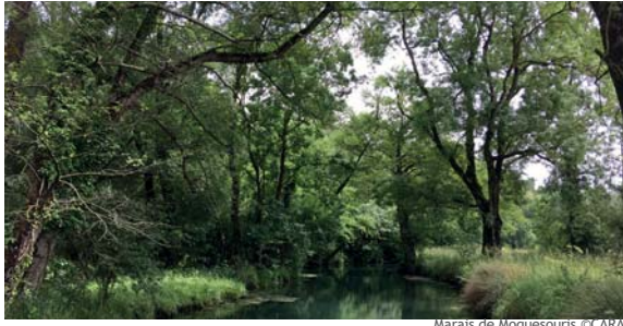
Marais de Moquesouris

Cet habitat est représenté par les boisements composés principalement d' aulnes glutineux ( Alnus glutinosa ) et de frênes ( Fraxinus excelsior ), poussant sur les berges de sources ou de cours d'eau à écoulement lent . Sur notre territoire, il est principalement localisé dans le marais de Moquesouris (Barzan, Chenac-Saint-Seurind'Uzet, Arces) et le marais de Beaulon (Saint-Dizant-du-Gua, Saint-Fort-sur-Gironde).