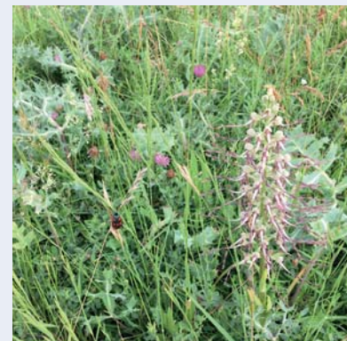
Zygone et Orchis Bouc

Si vous souhaitez en savoir plus sur les contrats Natura 2000, n'hésitez pas à contacter l'animatrice Natura 2000 qui est à votre écoute et vous accompagnera dans cette démarche. Propriétaire privé, vous pouvez également souscrire un contrat Natura 2000 pour contribuer à la préservation de la biodiversité !