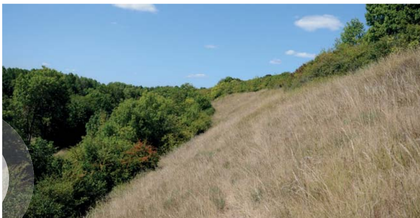
Coteaux de Moquesouris

Dans le dernier numéro de FOCUS Natura 2000, nous vous présentions les premiers contrats Natura 2000 signés par les communes de Meschers-sur-Gironde et de Saint-Georges-de-Didonne. Maintenant, direction la commune d'Epargnes où un autre contrat Natura 2000 a été signé en 2017 par le Conservatoire Régional d'Espaces Naturels (CREN) pour un montant de 39 480 €.