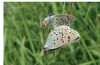
Azuré du Serpolet

qui pond ses œufs uniquement sur les fleurs de ces plantes. Mais tout n'est pas joué pour ce papillon une fois ses œufs déposés, puisque la chenille a besoin d'une espèce très particulière de fourmis pour passer l'hiver dans leur fourmilière !