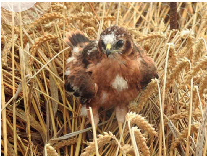
Jeune Busard cendré