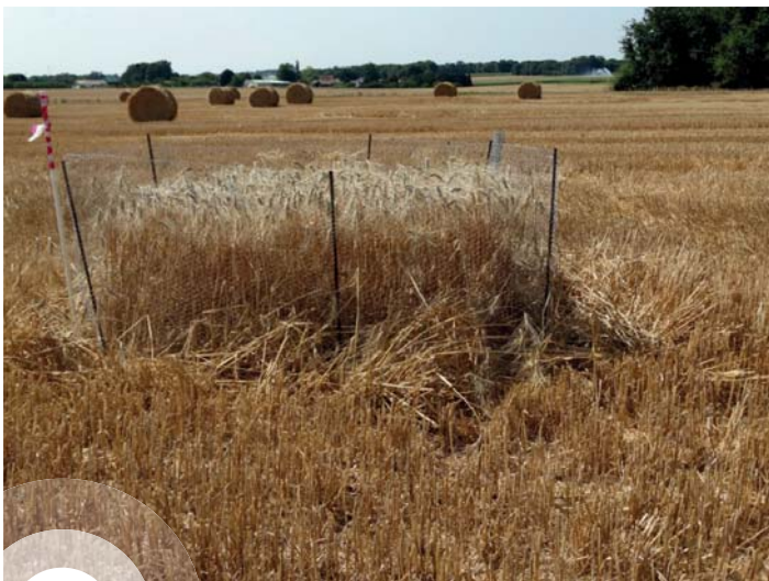
Protection de nid

Deux actions sont possibles, choisies en concertation avec l'agriculteur . La première consiste à retarder la date de récolte afin d'attendre que les poussins soient en âge de voler ; cette première solution est en réalité difficilement applicable car les dates de récolte sont étroitement liées aux conditions météorologiques ne permettant pas forcément leur report. La seconde solution est la pose de protection autour des nids , après accord de l'agriculteur. Ces protections sont créées avec des piquets et un grillage, et sont d'une dimension assez large pour que les adultes puissent continuer à accéder au nid pour prendre soin de leurs poussins. Cette protection a un double usage : signaler à l'agriculteur la localisation exacte du nid et éviter la dispersion des poussins dans le champ lorsque la moisson débutera.