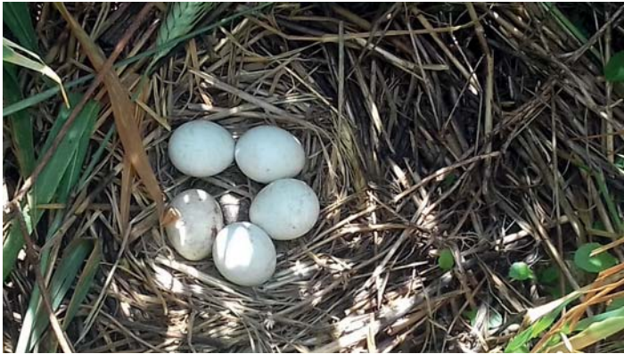
Nid de Busard cendré

Ces rapaces ont la particularité de faire leur nid directement au sol , dans les champs où sont principalement cultivés le blé, l'orge, le colza ; offrant ainsi un couvert homogène et donc une protection visuelle des nids.