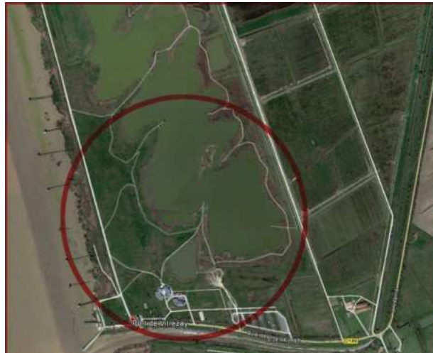
Quelques images du site Echappée nature de Port Maubert