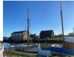
Vue de face depuis la grève